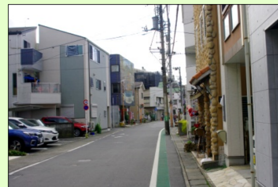
現在の街並み(旧)中野島中央通り