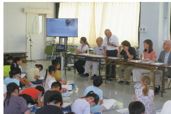
理事の回答 障害者福祉部