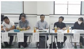
菅中学校・南菅中学校・菅高等学校