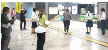
J R 稲田堤駅