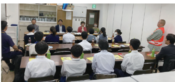
駅頭キャンペーン反省会