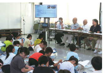
理事の回答 会食委員会