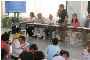
理事の回答 高齢者福祉部