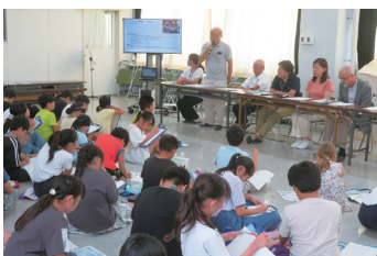
理事の回答 ミニデイケア委員会