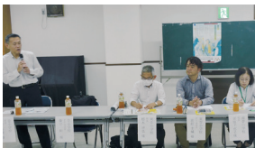
菅小学校・東菅小学校・南菅小学校

※令和元年5月28日に多摩区登戸で起きた、通り魔事件。私立学園の小中学生1名と保護者の1名が犠牲となった事件を契機に、毎月この日に菅町会では青パトによる町内のパトロールを行っている。