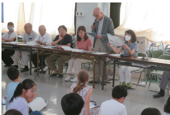
理事の回答 企画部