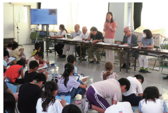
理事の回答 こども福祉部