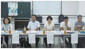
南菅小学校・西菅小学校・菅中学校