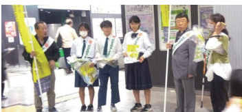
J R 稲田堤駅